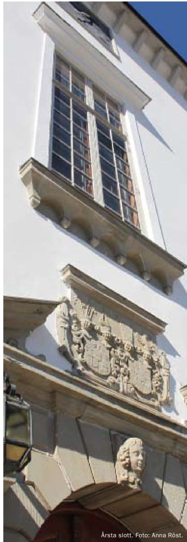
Årsta slott.

En byggnad eller bebyggelsemiljö kan även vara särskilt