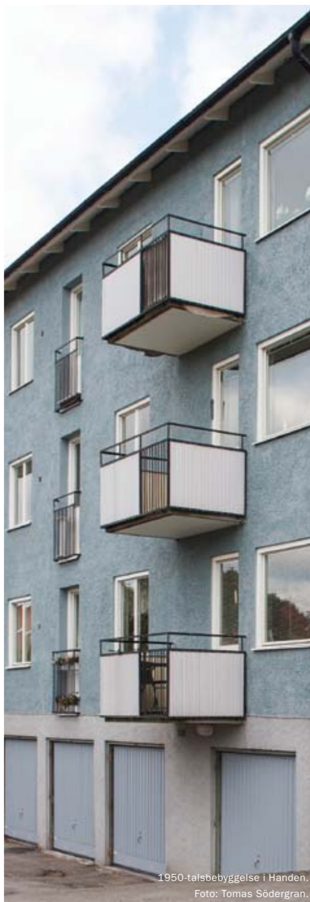
1950-talsbebyggelse i Handen.