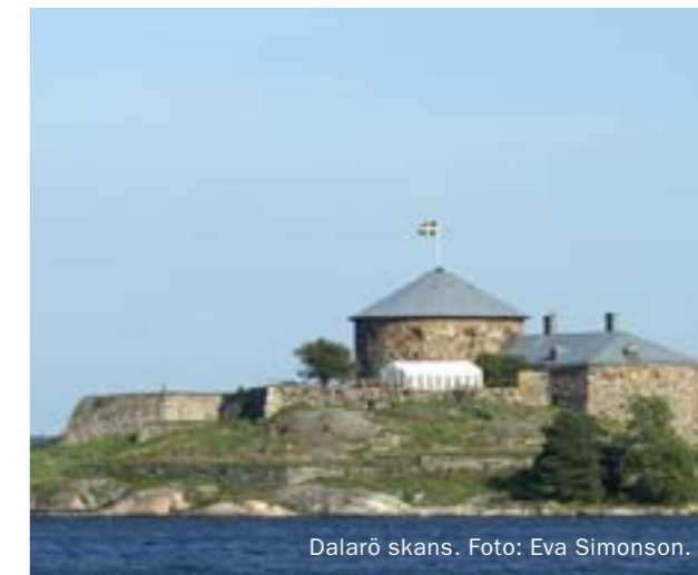
Dalarö skans.

I Haninge kommun finns 3662 registrerade fornlämningar och övriga kulturhistoriska lämningar (2017-12-29). Bland dessa finns fyndplatser, boplatser, lämningar, gravar, runstenar, vrak på havets botten och mycket annat. De finns i Riksantikvarieämbetets söktjänst Fornsök: www.raa.se/fornsok Information om hur det går till när en fornlämning berörs av arbete finns på Länsstyrelsens webbplats.