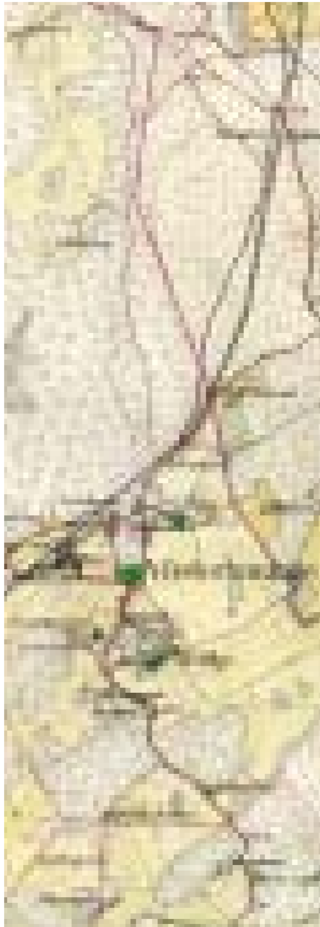
Häradsekonomska kartan från 1901-1906.

skärgården (1983) 2 och en uppdatering/komplettering av fastlandsdelen (2004) 3 . De två äldsta är i hög grad baserade på en rad äldre bebyggelseinventeringar som utfördes under 1960- och 70-talet 4 . I början av 2000-talet återinventerades de fastlandsmiljöer som upptagits 1980. Texterna kompletterades och nya fotografier av miljöerna togs.