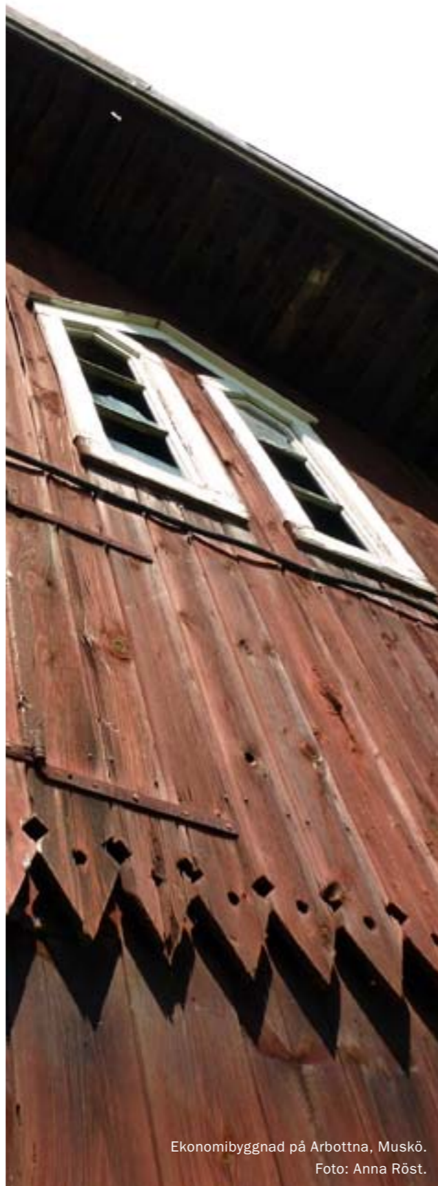
Ekonomibyggnad på Arbottna, Muskö.

Du som är fastighetsägare är skyldig att underhålla dina byggnader, och underhållet ska ske med hänsyn till byggnadernas kulturhistoriska värden. En byggnads karaktär