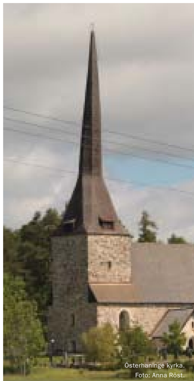
Österhaninge kyrka.

I PBL 8 kap. 13 §, det s k Förvanskningförbudet bestäms att byggnader, bebyggelseområden och allmänna platser som är särskilt värdefulla från historisk, kulturhistorisk, miljömässig eller konstnärlig synpunkt inte får förvanskas. Förvanskningförbudet gäller vid alla ändringar, interiört och exteriört, och oavsett om ändringen är bygglovs- eller anmälningspliktig. Rivning av byggnad är dock inte att ses som förvanskning eftersom byggnaden försvinner. Förvanskningförbudet är dock inte ett förbud mot förändring, utan skyddar enbart de egenskaper som utgör det särskilda värdet. Vid prövning bör det klarläggas om en föreslagen åtgärd förändrar byggnadens karaktärsdrag eller skadar någon av de egenskaper som ligger till grund för byggnadens eller området kulturvärden.