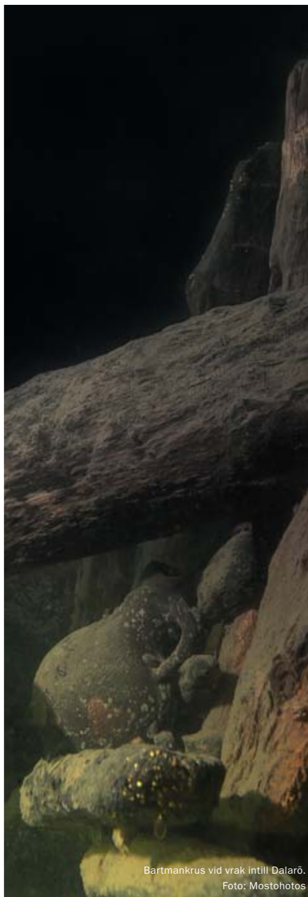
Bartmankrus vid vrak intill Dalarö.

Fornlämningar och fornfynd behandlas i kulturmiljölagens andra kapitel. Fornlämningar och det omgivande fornlämningsområde som hör till fornlämningen (det område som krävs för att bevara fornlämningen och ge